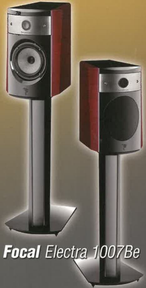
Focal Electra 1007Be

Harman Kardon HS100 Pioneer DV696 Velodyne SPL1000R KEF KHT-3005